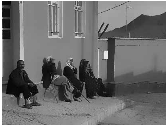
تصویر ۲. روستای هن جن از توابع ایبانه، پیرنشین در مرکز محله، منبع: نگارنده